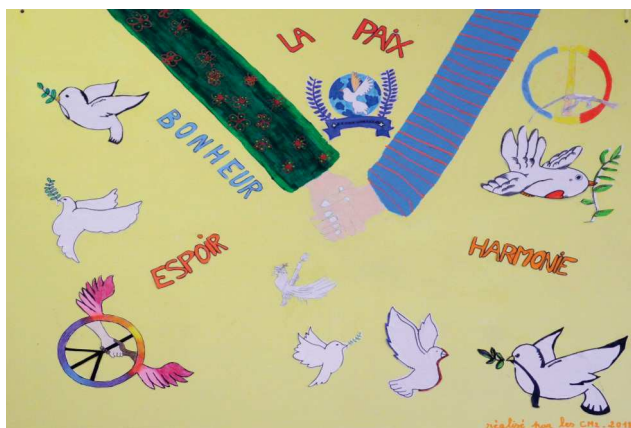
Tableaux sur la guerre et la paix réalisés par les élèves de CM1 et CM2 du village