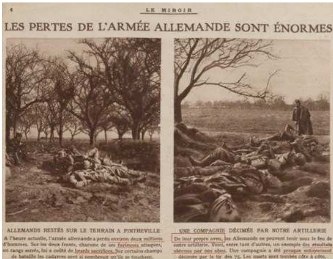
Le Miroir du 7 mars 1915

des chefs ennemis et non des soldats allemands, ou des figures religieuses « le bon vieux dieu boche ».