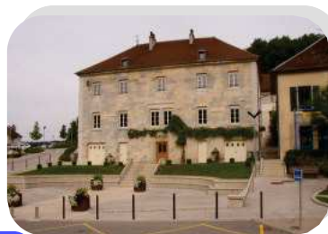
La mairie, au centre du village