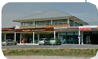
L'espace St Laurent